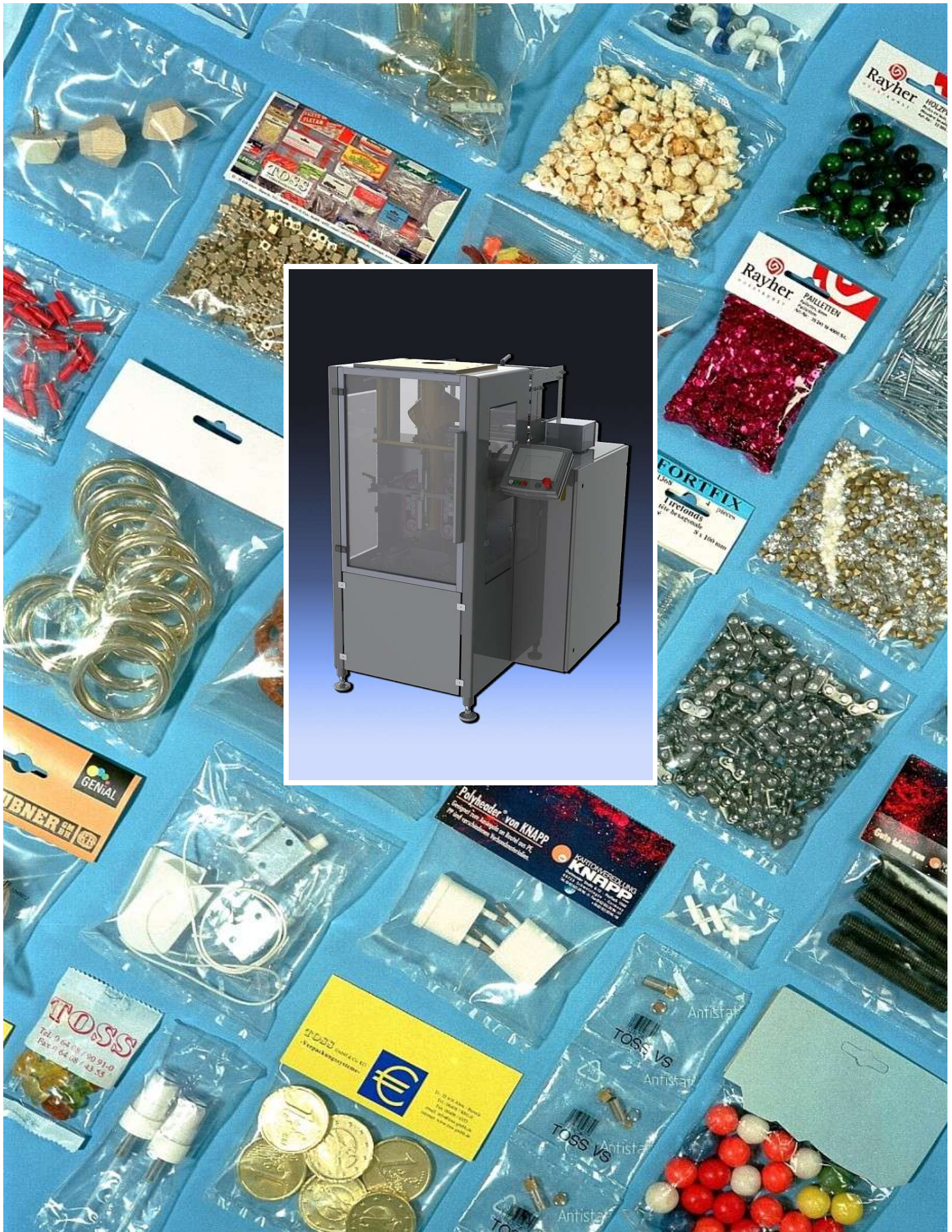
Die kompakte Maschine mit der großen Vielseitigkeit Great versatile compact packaging machine